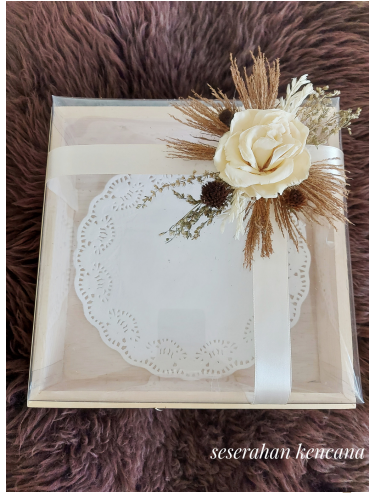
Wood Rustic Rp 80.000/Box