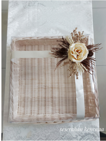
Rotan Rustic Rp 70.000/Box

Untuk seri flower, hiasan bunga hanya dipinjamkan, wajib dikembalikan