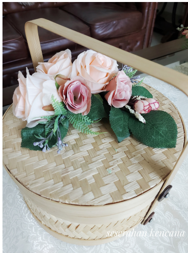
Bamboo Flower Rp 80.000/Box