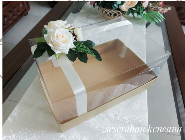
Basic Box Flower Rp 60.000/Box Available in White, Gold, and Grey